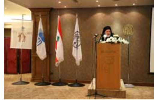
مدرسة الثلاثة الأقمار تعيد ١٧٥ سنة

من العام ١٨٣٥ إلى العام ٢٠١٠، مئة وخمسة وسبعون سنة مرّت على صرح تربويّ شهدته حجارته وأعمدته تاريخاً حافلاً بالأحداث، ولكنها في الوقت عينه تشهد لحجارة أخرى بشرية كانت هي الركائز الحقيقية لهذه الديمومة. والمؤسسة التي تنشأها الكنيسة وترعاها، هي كالكنيسة في حضورها، حيةً بأبنائها الملتزمين العمل فيها، ليكون البشر شهوداً للحق، ملحاً وخميراً، معلمين ليس بالقول فقط بل وبحياتهم وسيرتهم.