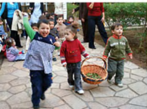
■ Au jardin des Jésuites ■

Tout au long des derniers mois, nous avons attendu impatiemment l'automne et, dès que les premiers nuages gris se sont amoncelés dans le ciel, nous avons visité le jardin des Jésuites où nous avons collecté des feuilles d'automne. Nous nous sommes amusés à sauter sur les tas de feuilles qui craquaient sous nos pas. Avec nos amis de la petite section, nous avons réalisé à la garderie une muraille qui représente la saison.