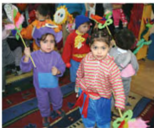
■ Les enfants déguisés: qui est qui? ■